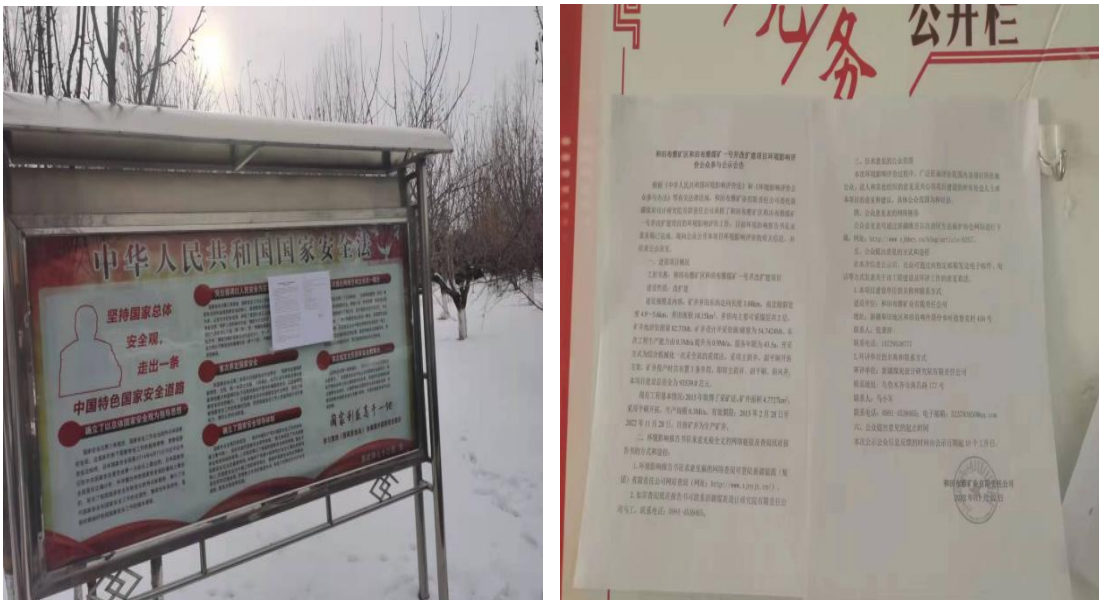
喀什塔什乡政府公告栏