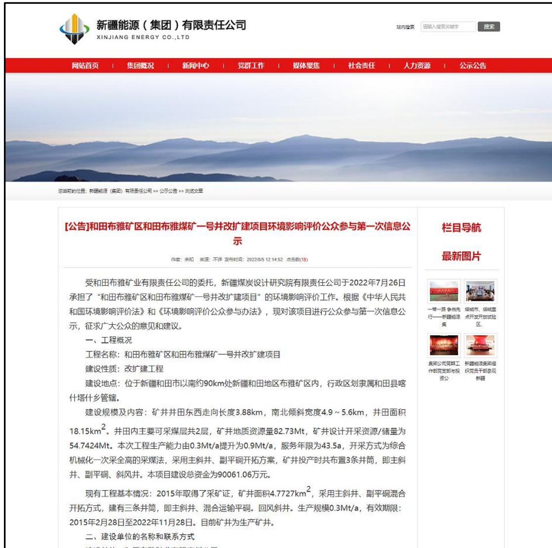
图 2-1 第一次公众参与网络公示截图

(http://www.xjnyjt.cn/) 发布了《和田布雅矿区和和田布雅煤矿一号井改扩建项目环境影响评价公参与第一次信息公示》，新疆（能源）集团有限责任公司是我公司全额控股公司。在该官网发布本项目环评信息公示，符合《办法》中规定要求。第一次公众参与网络公示截图详见图 2-1。