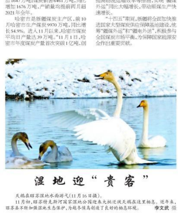
天鹅在昭苏湿地公园水面嬉戏(11月16日摄)。11月初,昭苏湿地公园迎来大批迁徙天鹅在此栖息。近年来,昭苏县不断加强湿地生态保护,为候鸟创造了良好的栖息环境。