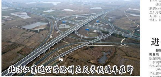
这是安徽路桥集团承建的北沿江高速公路滁州至天长段通车在即。

李国利说,神舟十五号载人飞船入轨后,将与正在轨运行的神舟十四号载人飞船、天和核心舱、问天实验舱、梦天实验舱组成“三舱两船”组合体,这是中国空间站目前最大规模、总质量最重、在轨运行时间最长的载人空间站组合体。